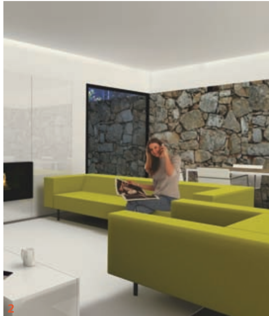
1 e 3 A reconstrução da casa está na fase final e a inauguração está marcada para o dia 17 de Setembro próximo. Neste momento já há pessoas interessadas em arrendar o alojamento rural, construído com materiais e equipamentos portugueses. 2 Os preços do alojamento apresentam valores muito amplos e desta forma permitem abranger diferentes públicos. Duas noites podem custar entre 170 euros e os 15 mil euros. Este último preço comporta um programa especial, que inclui a contratação de grupos musicais, para espectáculos em privado, contratação do 'buffet', através de restaurantes da região e a ocupação dos tempos livres das crianças. 4 e 5 A reconstrução do espaço de alojamento local começou em Outubro de 2010, dando corpo a uma casa onde se conjugam os elementos tradicionais de construção com as linhas simples da arquitectura contemporânea.